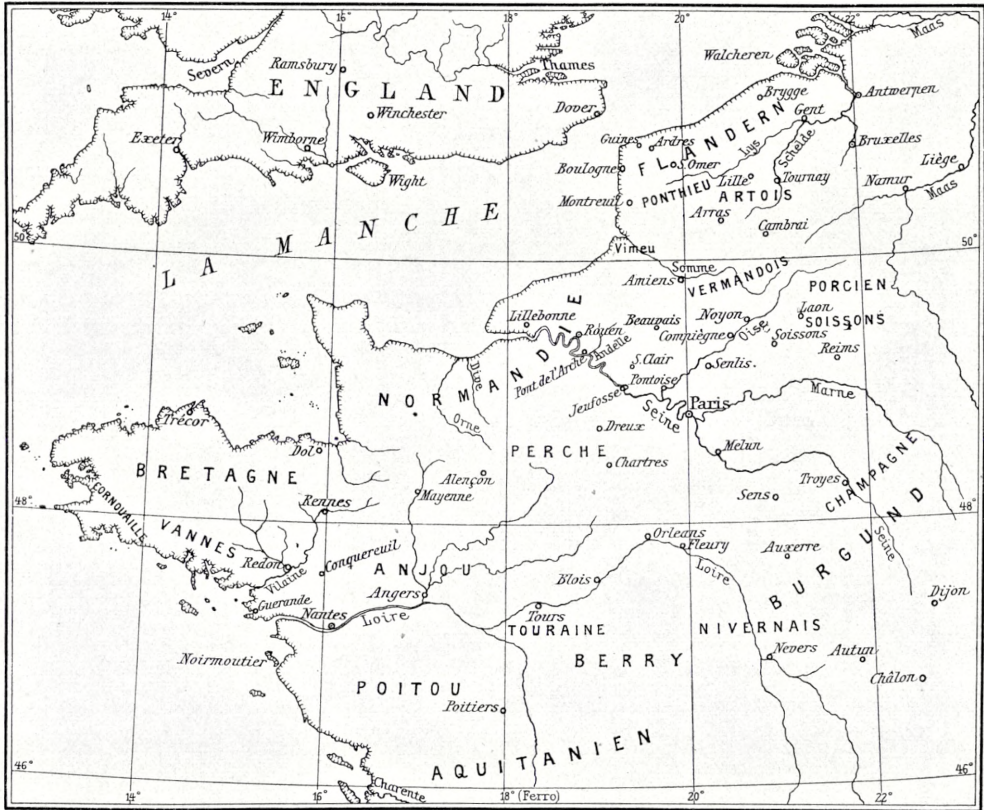
Kort over det nordlige Frankrig.

han — efter andre Kilder — medbragte fra England; Stedet kom senere til at bære Navn efter hende. Dudo har her benyttet den stedlige Tradition, vi finder andetsteds Oplysning om, at der her i Middelalderen laa en ecclesia St. Amgertrudis 1) . Men naar Dudo derpaa lader Ærkebisp Franco forhandle med Rollo paa Rouen-Købmændenes Vegne, har han givet Franco en Stilling, som han næppe havde før o. 910.